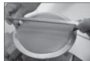
Mesa de Fluidez ( Flujo )

Cuando el grout se le solicita a un productor de concreto premezclado, las especificaciones deberán estar basadas en la resistencia a compresión y la consistencia. La conversión de la dosificación por volumen en dosificación por peso para cada yarda o metro cúbico está sujeta a errores y puede conducir a controversias en el trabajo.