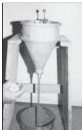
Cono de Fluidez ( Flujo )

La Norma ASTM C476 para los grouts de mampostería, establece las dosificaciones por volumen lo cual resulta conveniente para pequeñas cantidades de grout mezcladas en la obra. Estos grouts tienen un alto contenido de cemento y tienden a producir resistencias mucho más altas 4 que las especificadas en el ACI 530 5 o los Códigos que se utilizan como patrón.